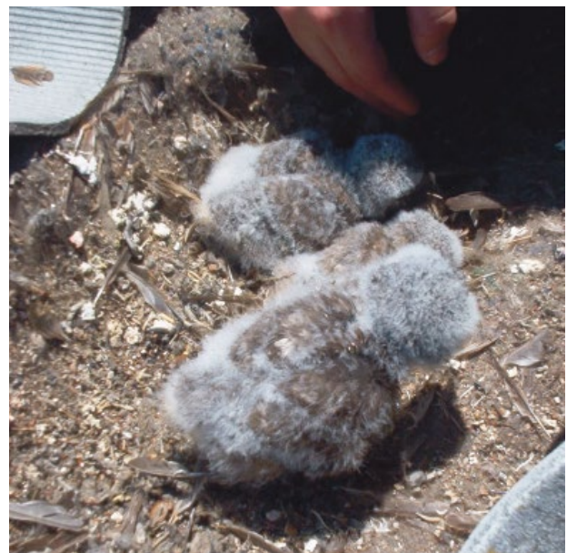
A még életben maradt fiókák a pala alatt (Apaj, 2005, Hámori Dániel) Survived chicks under the slate