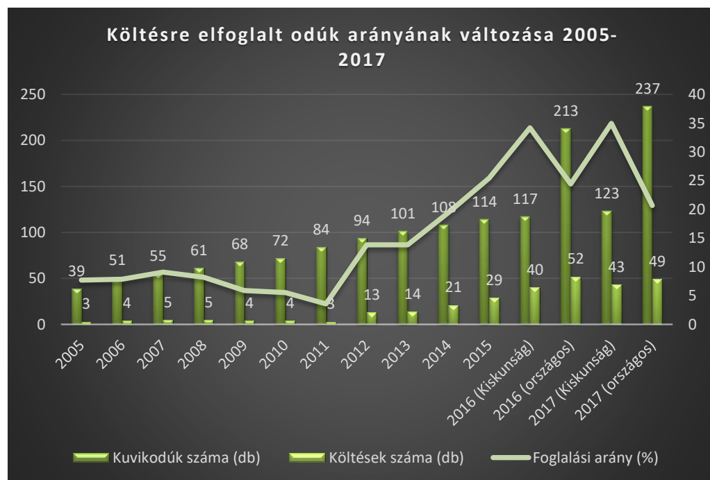
Költésre elfoglalt odúk arányának változása (2005-2017)

Az odúkból a sikeresen kirepült fiókaszám összesen min. 121 egyed ( 2. ábra ). Az átlagos hazai fiókaszám (sikeres költések száma – sikeresen kirepült fiókák száma) 3,56.